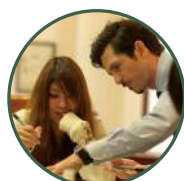
英語カルチャーレッスン ※事前予約優先

英語カルチャーレッスンの受講や、レストランだけでもご利用可能です。ぜひお気軽にお越しください。