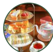
レストラン アスコットティールーム