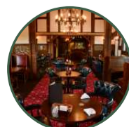
レストラン フォルスタッフパブ