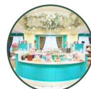
ギフトショップ ビクトリアンアレー