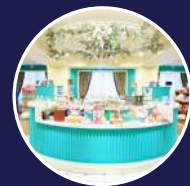
ギフトショップ ビクトリアンアレー