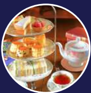
レストラン アスコットティールーム