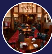
レストラン フォルスタッフパブ