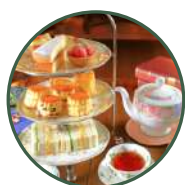
レストラン アスコットティールーム