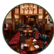
レストラン フォレストスタッフパブ