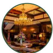
マナーハウスツアー ※事前予約優先