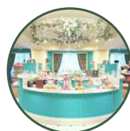
ギフトショップ ビクトリアンアレー