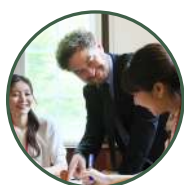
英語カルチャーレッスン ※事前予約優先

英語カルチャーレッスンの受講や、レストランだけでもご利用可能です。ぜひお気軽にお越しください。